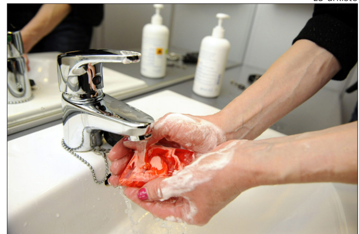
Flunssakausi on taas täällä. Tartuntaa vastaan voi taistella hyvällä käsihygienialla.

Enterorokko on kuume-tauti, joka aiheuttaa rakkuloita esimerkiksi suuhun, käsiin ja jaloihin. Lapsilla voi ilmetä myös nielukipua ja vatsavaivoja. Tauti