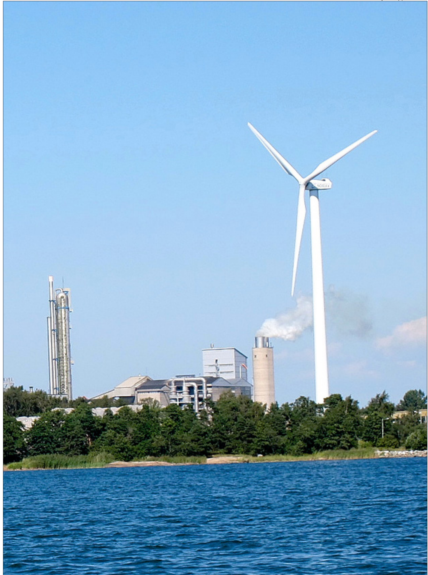
Tuulivoimaloiden rakentaminen pelkällä suunnittelutarvehakemuksella ei ole Pyhärannan kunnanhallituksen mielestä mahdollista Pyhärannan keskeisessä osassa. Uudessakaupungissa tuulesta tehdään voimaa Hangon saarella.

– Siitä otetaan opiksi, ja Uutis-Ankkuria tullaan hyödyntämään, Sarilo lupaa.